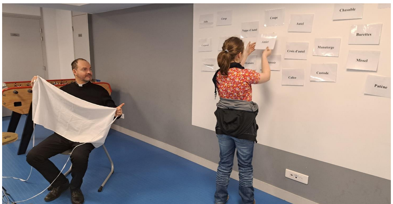
Panneaux au mur