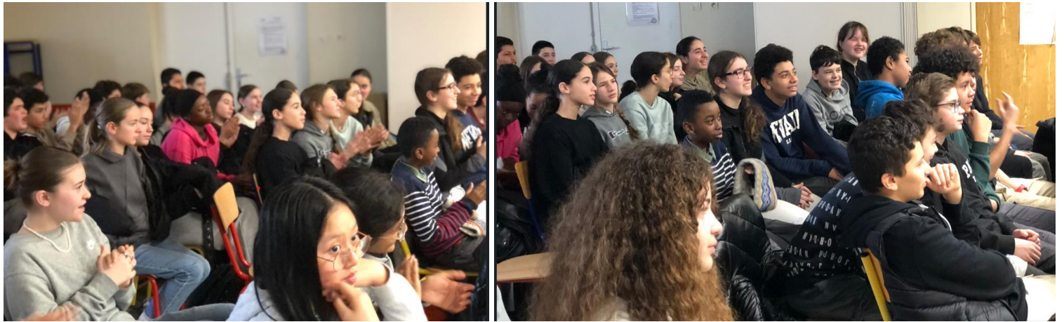
Photos de la formation PSC1 pour les élèves de quatrième 1.